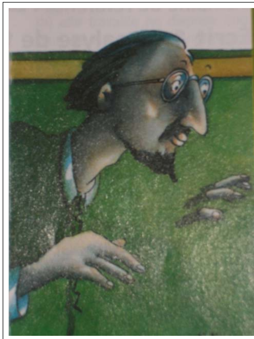
Mon « petit » copain au cimetière Jacques Duvin

Les yeux bleus regardaient le plan du cimetière dans ses petites mains. Elle marcha sur un trottoir puis elle tourna à gauche et continua d'avancer ; elle passa devant des tombes et s'arrêta. Elle sortit un bouquet de fleurs de son sac et le posa sur un tombeau de marbre. Le nom écrit sur la pierre n'était pas clair. C'était celui de sa mère. Elle rêva de revoir sa mère. Dans son rêve, elle eut des ailes à son dos et devint petite comme un insecte ; elle rencontra un autre insecte et avec lui elle fit un long voyage pour remettre les fleurs à sa mère.